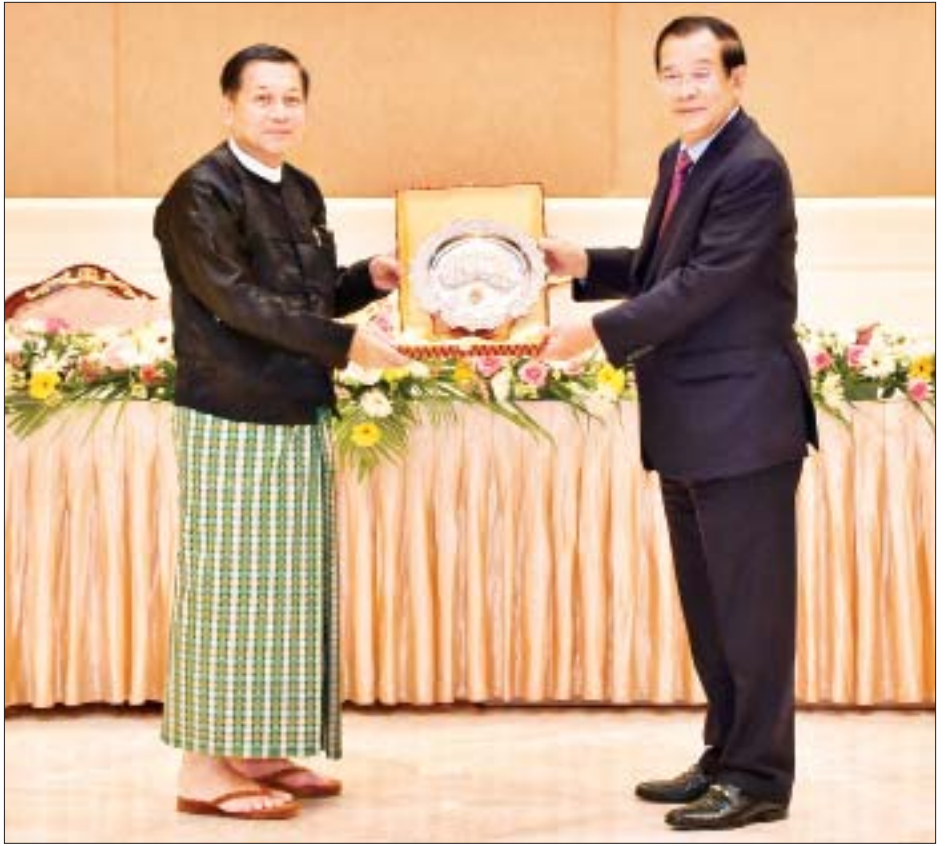
နိုင်ငံတော်စီမံအုပ်ချုပ်ရေးကောင်စီဥက္ကဋ္ဌ၊ နိုင်ငံတော်ဝန်ကြီးချုပ် ဗိုလ်ချုပ်မှူးကြီးမင်းအောင်လှိုင်နှင့် ကမ္ဘောဒီးယားနိုင်ငံဝန်ကြီးချုပ် Samdech Akka Moha Sena Padei Techo HUN SEN တို့ အမှတ်တရလက်ဆောင်ပစ္စည်းများ အပြန်အလှန် ပေးအပ်ကြစဉ်။