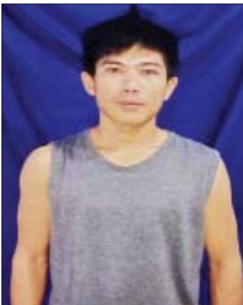
တရားခံ မြတ်သူ(ခ)နတ်ဆိုး