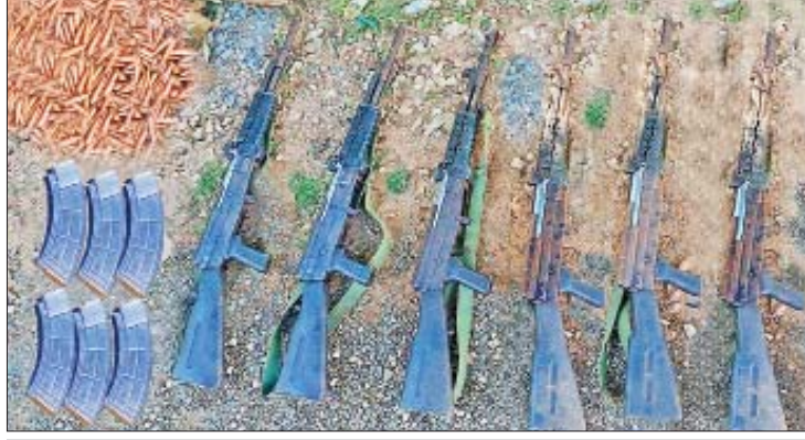
KNPP အဖွဲ့နှင့် PDF အမည်ခံ အကြမ်းဖက်အဖွဲ့များထံမှ သိမ်းဆည်းရမိသည့် လက်နက်၊ ခဲယမ်းနှင့် ဆက်စပ်ပစ္စည်းများကို တွေ့ရစဉ်။

တည်ငြိမ်ရေးနှင့် လုံခြုံရေးအတွက် လိုအပ်သော လုံခြုံရေးလုပ်ငန်းများကို နေ့ညမပြတ် ဆောင်ရွက်လျက်ရှိရာ အကြမ်းဖက်အဖွဲ့များအနေဖြင့် လုံခြုံရေးတပ်ဖွဲ့ဝင်များ၏ အလစ်အပိုက်ရယူ၍ နှောင့်ယှက်ပစ်ခတ်တိုက်ခိုက်ခြင်း၊ မိုင်းဆွဲတိုက်ခိုက်ခြင်းများအပြင် အများပြည်သူ သွားလာလျက်ရှိသည့် နယ်စပ်လမ်းတစ်လျှောက် အဖျက်အမှောင့်လုပ်ရပ်များကိုပါ လုပ်ဆောင်လျက်ရှိသဖြင့် လုံခြုံရေးတပ်ဖွဲ့ဝင်များက ROE စည်းမျဉ်းစည်းကမ်းနှင့်အညီ နယ်မြေဒေသလုံခြုံရေးလုပ်ငန်းများ တိုးမြှင့်ဆောင်ရွက်လျက်ရှိကြောင်း သိရသည်။ သတင်းစဉ်