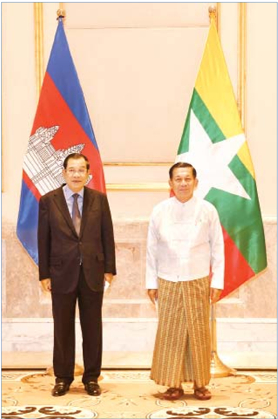
နိုင်ငံတော်စီမံအုပ်ချုပ်ရေးကောင်စီဥက္ကဋ္ဌ၊ နိုင်ငံတော်ဝန်ကြီးချုပ် ဗိုလ်ချုပ်မှူးကြီးမင်းအောင်လှိုင် နှင့် ကမ္ဘောဒီးယားနိုင်ငံဝန်ကြီးချုပ် Samdech Akka Moha Sena Padei Techo HUN SEN တို့ မှတ်တမ်းတင်ဓာတ်ပုံရိုက်ကြစဉ်။

☆ ရှေ့ဖိုးမှ သည်။ မှတ်တမ်းစာအုပ်တွင်မှတ်တမ်းတင် လက်မှတ်ရေးထိုး၍ နိုင်ငံတော် စီမံအုပ်ချုပ်ရေးကောင်စီ ဥက္ကဋ္ဌ၊ နိုင်ငံတော်ဝန်ကြီးချုပ်နှင့် အတူ မှတ်တမ်းတင် ဓာတ်ပုံရိုက်ကြ