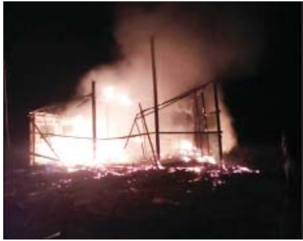
မြောင်းမြမြို့နယ် ကံကုန်းကျေးရွာရှိ ကိုယ့်အားကိုးကိုး မူလတန်းကျောင်းအား မီးရှို့ဖျက်ဆီးမှု မှတ်တမ်းဓာတ်ပုံ။

အကြမ်းဖက်သမားများအနေဖြင့် ကလေး သူငယ်များ အေးချမ်းစွာ ပညာသင်ကြားလျက်ရှိ သည့် စာသင်ကျောင်းများအား မိုင်းထောင်ဖောက်ခွဲ ခြင်း၊ မီးရှို့ဖျက်ဆီးခြင်းနှင့် အခြားအကြမ်းဖက် လုပ်ရပ်များကို ကျူးလွန်ခဲ့သည့် အကြမ်းဖက်သမား များအား အမြန်ဆုံးဖော်ထုတ် ဖမ်းဆီးရမိနိုင်ရေး လုံခြုံရေးတပ်ဖွဲ့ဝင်များက ဆက်လက်ဆောင်ရွက် လျက်ရှိကြောင်း သိရသည်။ သတင်းစဉ်