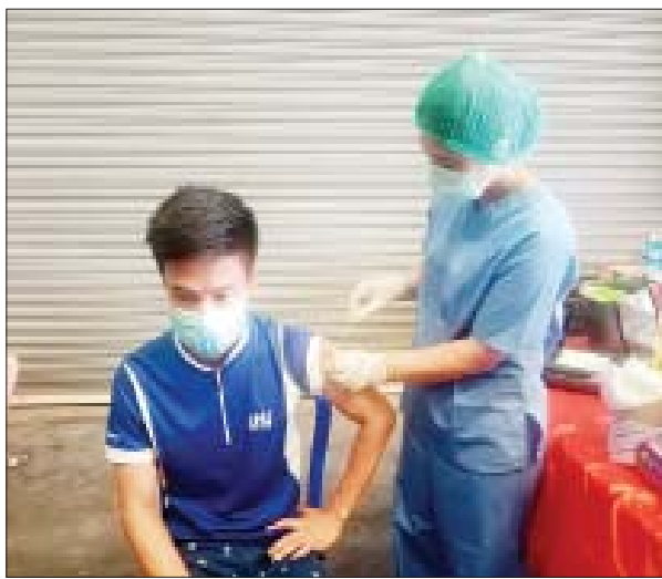
ညောင်ဟိန်း

၁၃၄၆၃၀ ကို ထိုးနှံပေးနိုင်ခဲ့ပြီး ဆက်လက်၍ ထိုးနှံပေးလျက်ရှိကြောင်း ဒုတိယမြို့နယ် ပြည်သူ့ကျန်းမာရေးဦးစီးဌာနမှူးက ပြောသည်။ အဆိုပါအင်းစိန်မြို့နယ် ရပ်ကွက်များရှိ ရပ်ကွက်နေပြည်သူများ ကိုဗစ်-၁၉ ရောဂါကာကွယ်ဆေး ထိုးနှံပေးမှုအခြေအနေများကို မြို့နယ် ကိုဗစ်-၁၉ ရောဂါ ထိန်းချုပ်ရေးကော်မတီ ဦးဆောင်မှုဖြင့် မြို့နယ်စီမံ အုပ်ချုပ်ရေးအဖွဲ့ တာဝန်ရှိသူများက ကြီးကြပ်ဆောင်ရွက်ပေးကြကာ မြို့နယ်ကြက်ခြေနီအသင်း ပရဟိတလူမှုရေးအဖွဲ့များ ပူးပေါင်းပြီး ကိုဗစ်-၁၉ ရောဂါကာကွယ်ရေးလုပ်ငန်းများကို ဆောင်ရွက်လျက်ရှိ ကြောင်း မြို့နယ် ကိုဗစ်-၁၉ ရောဂါထိန်းချုပ်ရေးကော်မတီထံမှ သိရသည်။