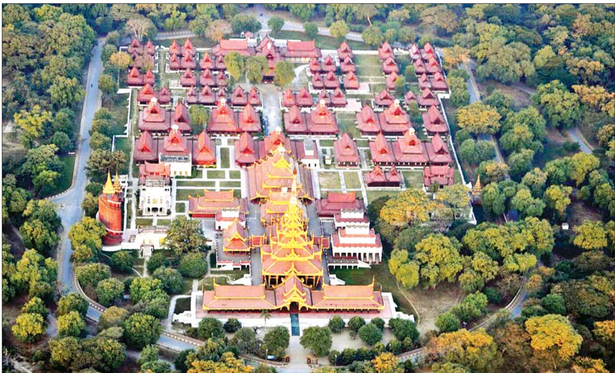
မြန်မာ့စံကျော် ရွှေနန်းတော်ကြီးကို ဝေဟင်မှတွေ့မြင်ရစဉ်။

နိုင်ငံများမှ ပြန်လည်ရောက်ရှိလာ၍ ကိုဗစ်-၁၉ ရောဂါပိုးတွေ့ရှိသူများ၏ ဓာတ်ခွဲနမူနာများအနက် ကိုဗစ်-၁၉ မျိုးရိုးဗီဇပြောင်း ရောဂါပိုးတွေ့ရှိနိုင်သည့် သံသယဖြစ်ဖွယ်ဓာတ်ခွဲနမူနာ (၂၂)ခုအား ၇-၁-၂၀၂၂ ရက်နေ့တွင် ကိုဗစ်-၁၉ ရောဂါ မျိုးရိုးဗီဇစစ်ဆေးခြင်းကို အမျိုးသားကျန်းမာရေးဓာတ်ခွဲခန်းဆိုင်ရာဌာနနှင့် အမှတ်(၁) တပ်မတော်ဆေးရုံကြီး ခုတင် (၁,၀၀၀) တို့တွင် ဆောင်ရွက်ခဲ့ရာ SARS-CoV-2 Variant Omicron (အိုမီခရွန်) ရောဂါပိုးကို ဓာတ်ခွဲနမူနာ(၁၂)ခုတွင် တွေ့ရှိရပါသည်။ စာမျက်နှာ ၁၂ ကော်လံ ၁ သို့ □