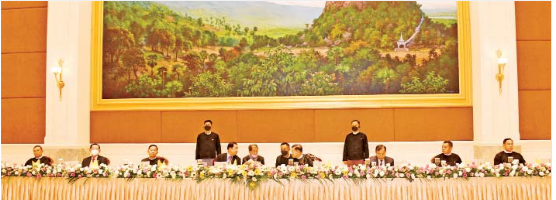
နိုင်ငံတော်စီမံအုပ်ချုပ်ရေးကောင်စီဥက္ကဋ္ဌ၊ နိုင်ငံတော်ဝန်ကြီးချုပ် ဗိုလ်ချုပ်မှူးကြီးမင်းအောင်လှိုင် ကမ္ဘောဒီးယားနိုင်ငံဝန်ကြီးချုပ် Samdech Akka Moha Sena Padei Techo HUN SEN ဦးဆောင်သော ကိုယ်စားလှယ်အဖွဲ့အား ဂုဏ်ပြုညစာဖြင့် တည်ခင်းဧည့်ခံစဉ်။