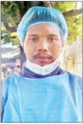
တရားခံ ညိုချော(ခ)ရာဇာ