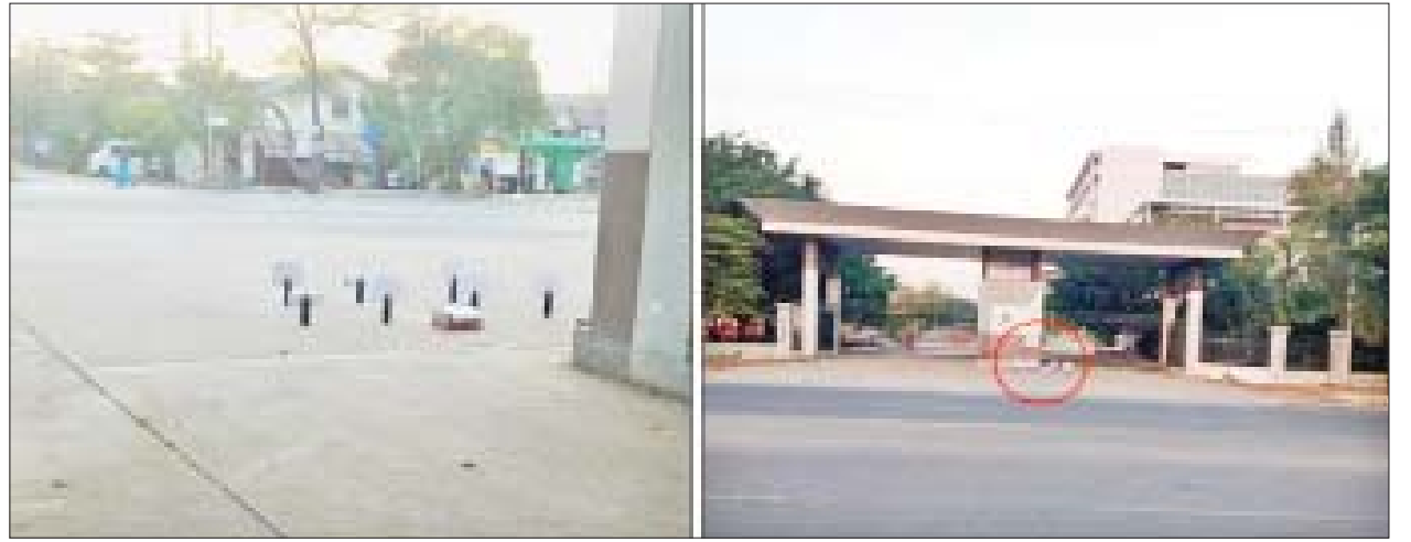
ချမ်းမြသာစည်မြို့နယ် MITT တက္ကသိုလ်၏ တောင်ဘက်ဝင်ပေါက်ရှေ့တွင် မသင်္ကာဖွယ်စက္ကူပုံးတစ်လုံးတွေ့ရှိမှု မှတ်တမ်းဓာတ်ပုံ။