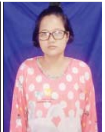
တရားခံ အိကေခိုင်(ခ)မအိ