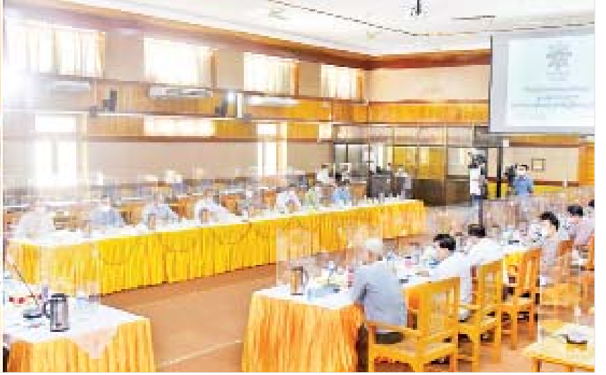
ပြည်ထောင်စုဝန်ကြီး ဦးမောင်မောင်အုန်း (၇၅)နှစ်မြောက် စိန်ရတုပြည်ထောင်စုနေ့အထိမ်းအမှတ် လူငယ်နှင့် စာပေပွဲတော် အခမ်းအနားကျင်းပရေး လုပ်ငန်းညှိနှိုင်း အစည်းအဝေးတွင် ဆွေးနွေးစဉ်။

ဒုတိယ ဥက္ကဋ္ဌများဖြစ်ကြသော ပညာရေး ဝန်ကြီးဌာန ပြည်ထောင်စုဝန်ကြီး ဒေါက်တာ ညွန့်ဖေနှင့် အားကစားနှင့် လူငယ်ရေးရာ ဝန်ကြီးဌာန ပြည်ထောင်စုဝန်ကြီး ဦးမင်းသိန်းဇံ အတွင်းရေးမှူးနှင့် ကော်မတီ အဖွဲ့ဝင်များ၊ ဖိတ်ကြားထား သူများ တက်ရောက်ကြသည်။