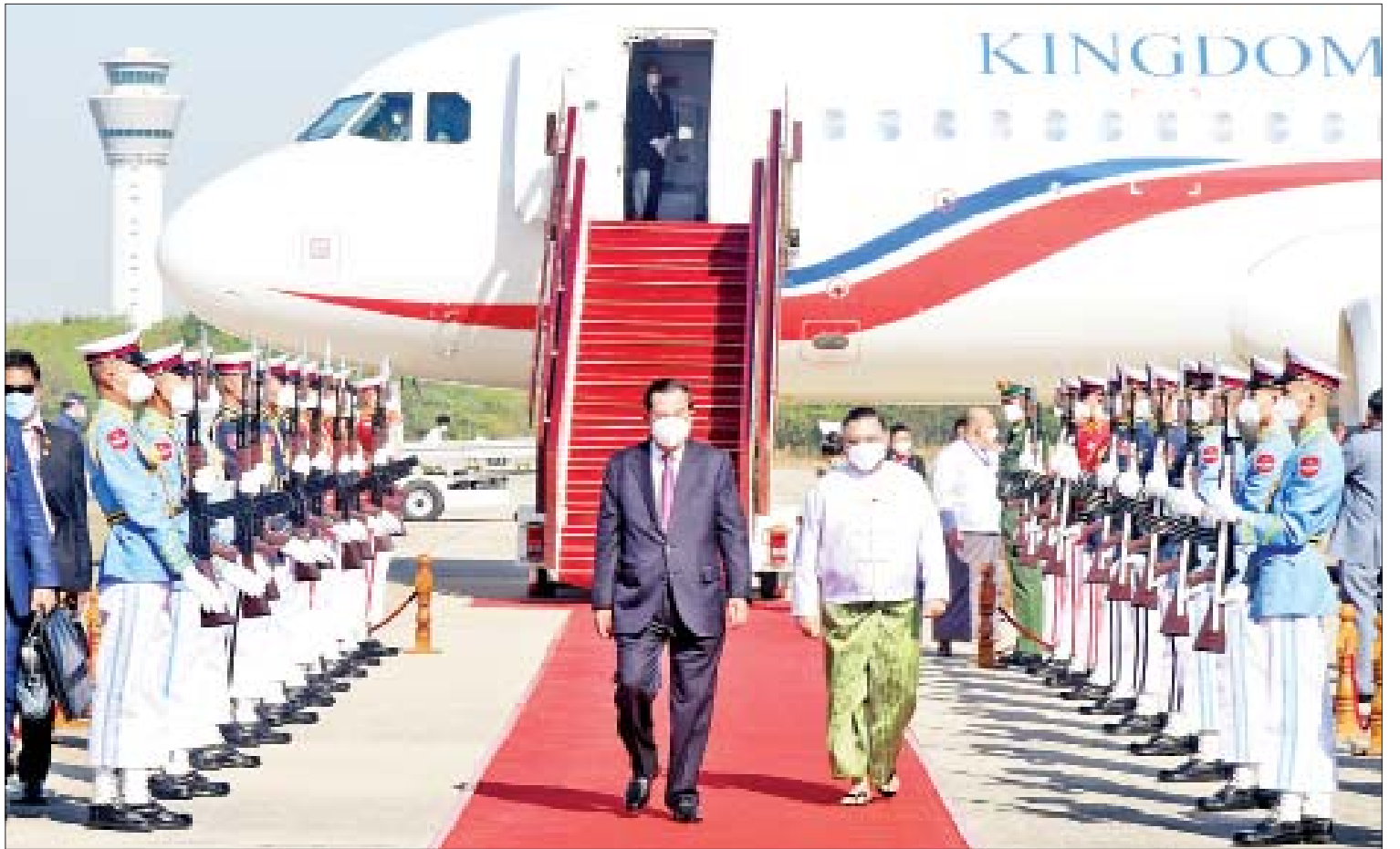
ကမ္ဘောဒီးယားနိုင်ငံဝန်ကြီးချုပ် Samdech Akka Moha Sena Padei Techo HUN SEN ဦးဆောင်သည့် ကိုယ်စားလှယ်အဖွဲ့အား နိုင်ငံခြားရေးဝန်ကြီးဌာန ပြည်ထောင်စုဝန်ကြီး ဦးဝဏ္ဏမောင်လွင်နှင့် တာဝန်ရှိသူများက ဂုဏ်ပြုတပ်ဖွဲ့နှင့်အတူ နေပြည်တော်အပြည်ပြည်ဆိုင်ရာလေဆိပ်၌ ကြိုဆိုနှုတ်ဆက်ကြသည်။

ထို့နောက် ကမ္ဘောဒီးယားနိုင်ငံ ဝန်ကြီးချုပ်ဦးဆောင်သည့် ကိုယ်စား လှယ်အဖွဲ့အား နိုင်ငံခြားရေးဝန်ကြီးဌာန ပြည်ထောင်စုဝန်ကြီး ဦးဝဏ္ဏမောင်လွင်၊ အပြည်ပြည်ဆိုင်ရာ ပူးပေါင်းဆောင်ရွက် ရေးဝန်ကြီးဌာန ပြည်ထောင်စုဝန်ကြီး ဦးကိုကိုလှိုင်၊ ကမ္ဘောဒီးယားနိုင်ငံဆိုင်ရာ မြန်မာနိုင်ငံသံအမတ်ကြီး ဦးသစ်လင်း အုန်း၊ နေပြည်တော်ကောင်စီ ဥက္ကဋ္ဌ ဒေါက်တာမောင်မောင်နိုင်နှင့် တာဝန်ရှိ သူများက ဂုဏ်ပြုတပ်ဖွဲ့နှင့်အတူ နေပြည်တော် အပြည်ပြည်ဆိုင်ရာ လေဆိပ်၌ ကြိုဆိုနှုတ်ဆက်ကြသည်။