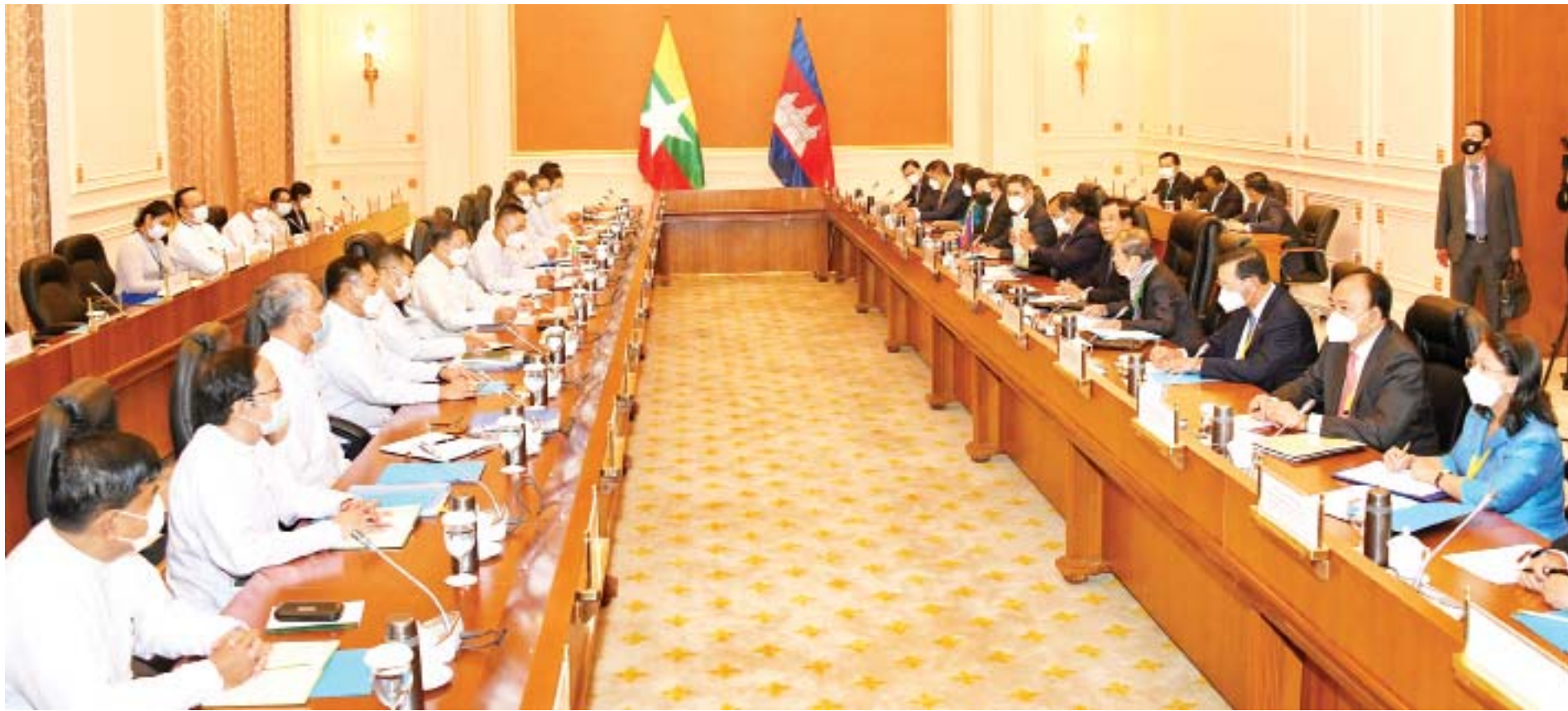
မြန်မာ-ကမ္ဘောဒီးယား နှစ်နိုင်ငံ တွေ့ဆုံဆွေးနွေးပွဲ ကျင်းပစဉ်။