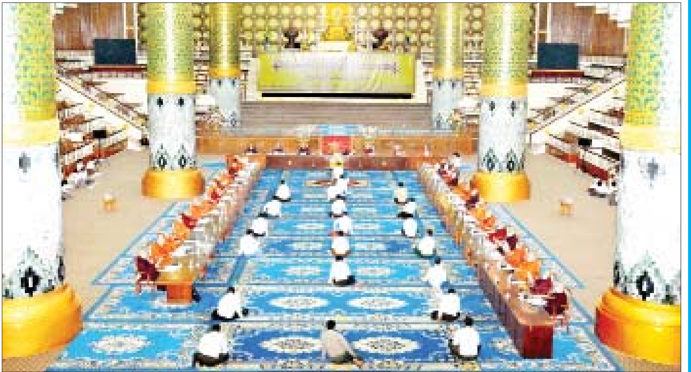
အဋ္ဌမအကြိမ် နိုင်ငံတော်သံသမဟာနာယက အဖွဲ့ (၄၇)ပါးစုံညီ နဝမအစည်းအဝေးကို နိုဝင်ဘာ ၂၆ ရက်က ရန်ကုန်မြို့ သီရိမင်္ဂလာ ကမ္ဘာအေးကုန်းမြေရှိ ဆဋ္ဌသင်္ဂါယနာတင် မဟာပါသာဏ လိုဏ်ဂူ သိမ်တော်ကြီး၌ ကျင်းပစဉ်။

ဆောက်လုပ်ရေးဝန်ကြီးဌာန ပြည်ထောင်စုဝန်ကြီး ဦးရွှေလေးသည် နိုဝင်ဘာ ၂၈ ရက်တွင် ရန်ကုန်တိုင်းဒေသကြီး ကျေးလက်လမ်းဖွံ့ဖြိုးရေး ဦးစီးဌာနက ဆောင်ရွက်သော တိုက်ကြီးမြို့နယ် အတွင်း ကျေးရွာချင်းဆက်လမ်း ကွန်ကရစ်ခင်းပြီးစီးမှု၊ လှိုင်မြစ် - လှော်ကား ရေအေးဖြည့်စီမံကိန်းဆောင်ရွက်မှု၊ ရန်ကုန် - ပြည်လမ်းပိုင်း မှော်ဘီမြို့အတွင်း မြေအောက်အနက် ၁၀ ပေတူး၍ ငါးပေအချင်းရှိ ရေပိုက်လိုင်းသွယ်တန်းထားမှု၊ ရန်ကုန်မြောက်ပိုင်းခရိုင် လမ်းဦးစီးဌာနက အမှတ်(၄) လမ်းမကြီး ပြုပြင်ထိန်းသိမ်းမှု၊ ရန်ကုန်-နေပြည်တော်-မန္တလေးအမြန်လမ်းမကြီး (ရန်ကုန်-နေပြည်တော်)အပိုင်း လမ်းဘေးသစ်ပင်များ ရှင်သန်ဖြစ်ထွန်းနေမှု၊ ယာဉ်အန္တရာယ်ကင်းရှင်းရေးအတွက် စက်ယန္တရားများဖြင့် မြေညှိခြင်းနှင့် ချွန်နှယ်များ ရှင်းလင်းထားမှုကို လမ်းတစ်လျှောက် ကြည့်ရှုစစ်ဆေးခဲ့သည်။