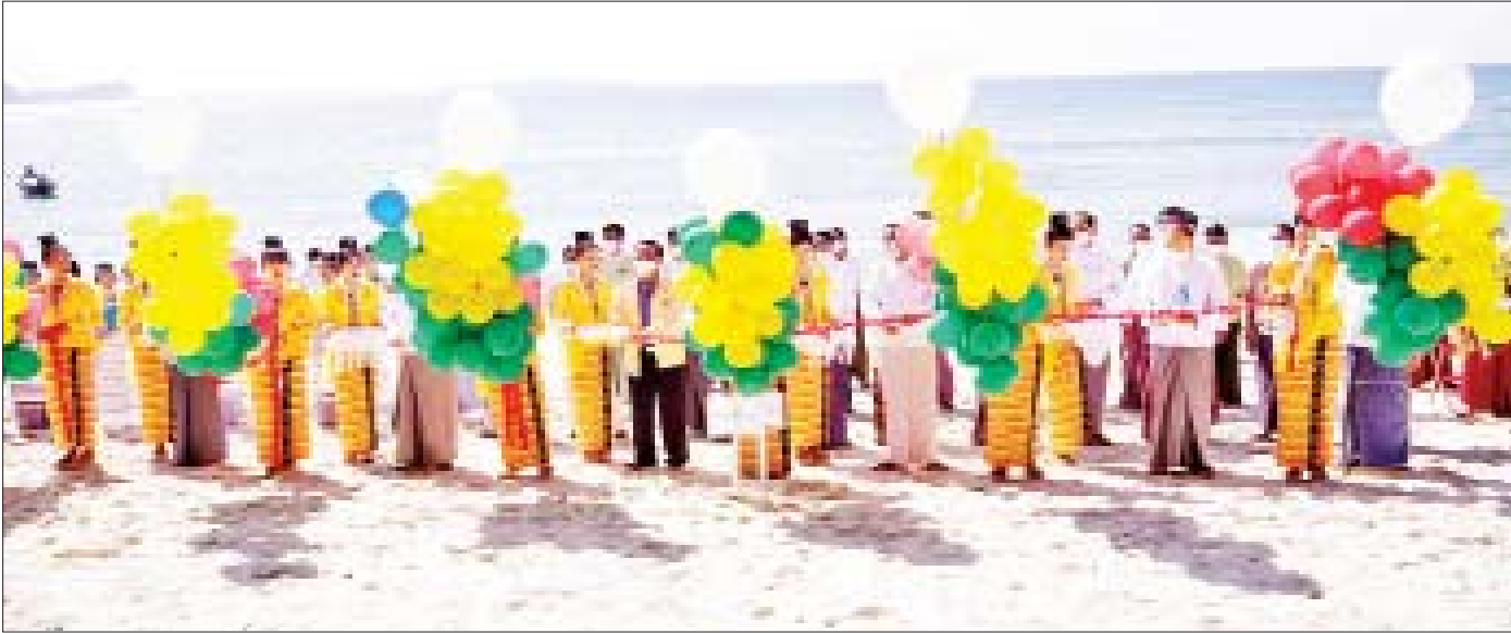
ရခိုင်ပြည်နယ် သံတွဲခရိုင် ငပလီမြို့ “ငပလီကမ်းခြေ ဆောင်းဦးပွဲတော်” ဖွင့်ပွဲအခမ်းအနားကို နိုဝင်ဘာ ၁၄ ရက်က ကျင်းပစဉ်။

တိုင်းစစ်ဌာနချုပ်နယ်မြေအသီးသီးရှိ အစိုးရ တပ်မတော်နှင့် ပုဂ္ဂလိကပိုင်ဒေသတွင်း စိုက်ပျိုး မွေးမြူရေးနှင့် အခြားလူသုံးကုန်လုပ်ငန်းများသို့ တိုင်းဒေသကြီးနှင့် ပြည်နယ်အသီးသီးမှ ဝန်ကြီးချုပ် များ၊ တိုင်းမှူးများနှင့် တာဝန်ရှိသူများက ကုန်ထုတ် လုပ်မှုလုပ်ငန်းများ ရာနှုန်းပြည့်ဆောင်ရွက်နိုင်ရေး နှင့် လိုအပ်သည်များ ပေါင်းစပ်ညှိနှိုင်းပေးနေသည် ကိုလည်း မြင်တွေ့ရသည်။ စီးပွားရေးနှင့် ကူးသန်း ရောင်းဝယ်ရေးဝန်ကြီးဌာနနှင့် မြန်မာနိုင်ငံ ဆီကုန်သည်နှင့် ဆီလုပ်ငန်းရှင်များအသင်းတို့က စားသုံးသူပြည်သူများ သက်သာသောဈေးနှုန်းဖြင့် ဝယ်ယူရရှိနိုင်ရန်ရည်ရွယ်၍ စားအုန်းဆီများကို နိုဝင်ဘာ ၉ ရက်မှစတင်ပြီး တိုင်းဒေသကြီး/ပြည်နယ် ဒေသအသီးသီးရှိ လက်လီ/လက်ကား ရောင်းချသူ များသို့ တစ်ပိဿာလျှင် လက်ကားဈေး ငွေကျပ်